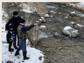
川釣り [3月～9月] River Fishing