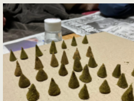
線香づくり [通年] Incense Stick Making