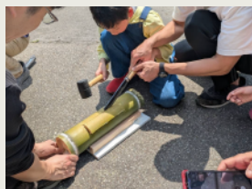
竹細工 (箆やランタン) [通年] Bamboo Crafting