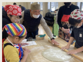
そば打ち [通年] Buckwheat making