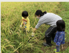
稲刈り [9月] Rice harvesting