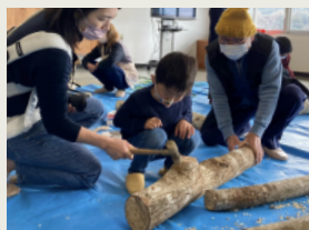
なめこの菌打ち [4月] Nameko Mushroom Inoculation