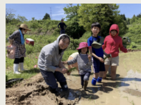
田植え [4月後半～5月] Rice Planting