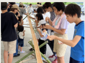
流しそうめん [7月～8月] Flowing Somen Noodles