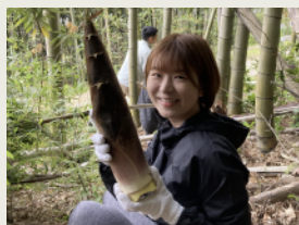
たけのこ掘り [4月下旬～5月上旬] Bamboo Shoot Digging