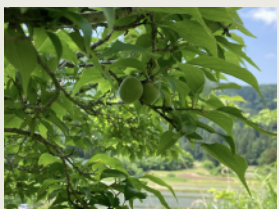
梅の収穫 [6月] Plum harvest