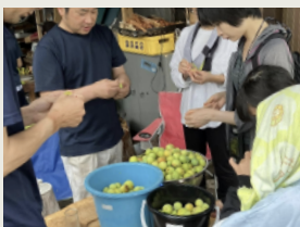
梅シロップ作り [6月] Making plum syrup