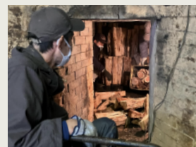
炭焼き小屋 [通年] Charcoal Kiln Hut