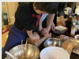
押し寿司 [通年] Pressed Sushi