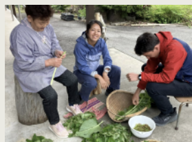
山菜収穫 [3月～7月] Harvesting wild vegetables

A variety of memorable experiences available *Please note that the event may be canceled due to weather conditions, etc.