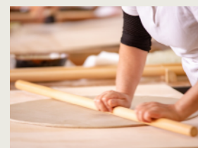
そば打ち Buckwheat making