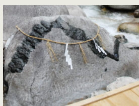
自然遺産巡りツアー「蛇石」 Natural Heritage Tour