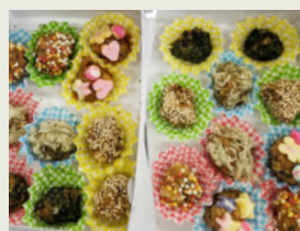
みそ玉作り Making miso balls