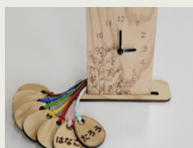
ウッドバーニング Wood Burning