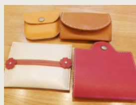
革小物作り Leather craft