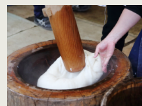
餅つき Pounding rice cakes