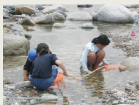
川遊び Playing in the river