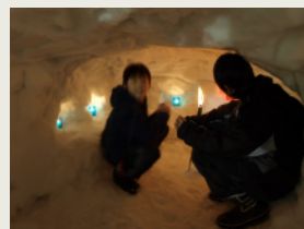
雪のかまくら作り Kamakura (Japanese snow dome)