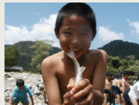
岩魚つかみ Catching Iwana (Char Fish) by Hand