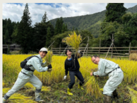
稲刈り Rice Harvesting

A variety of memorable experiences available *Please note that the event may be canceled due to weather conditions, etc.