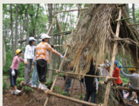
小屋づくり Hut Building