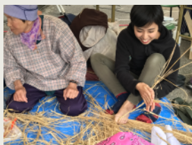
わら細工 Straw Crafts