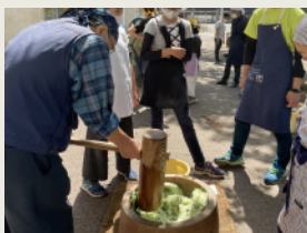
伝統食づくり Traditional Food Preparation