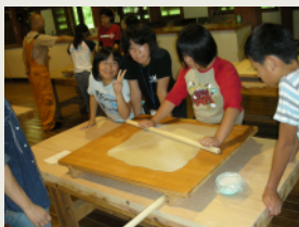
そば打ち Buckwheat making