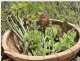
山菜採り Picking Wild Vegetables