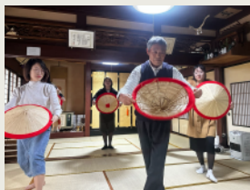
民謡 Folk Dance Performance