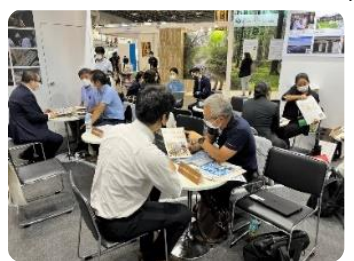
全国規模の観光フェアへ出展